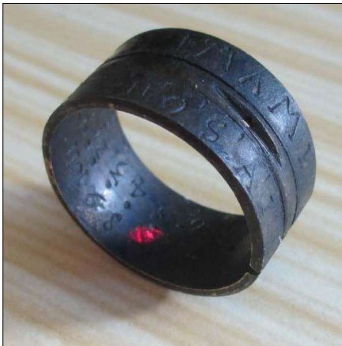
Afbeelding 5.: het aflezen van de lichtbundel geïllustreerd met behulp van een laserpointer.

Met het dalen van de zon dient vanaf het keerpunt vanaf het onderste rijtje van 12 uur tot en met 8 uur te worden afgelezen. Een test wees uit dat de lichtbundel eigenlijk alleen goed afleesbaar is wanneer het onbewolkt is en de zon direct op de ring schijnt.