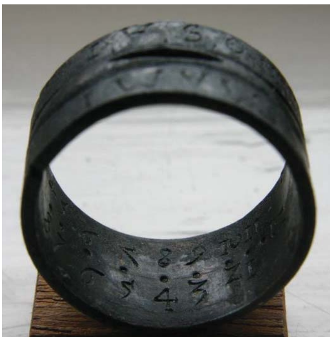
Afbeelding 1: De ring