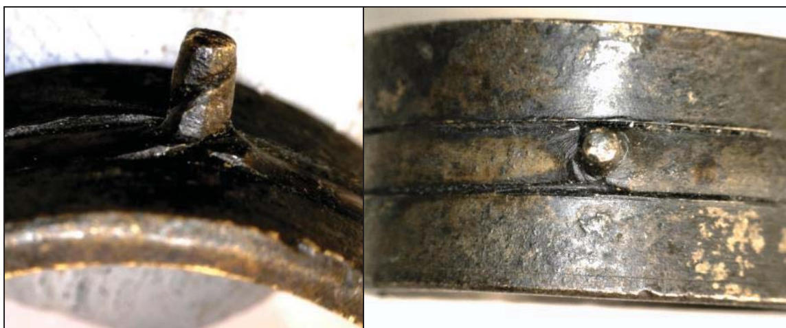
Afbeelding 4: Het handvat (links: van de zijkant gezien; rechts van boven gezien)

Naar analogie van andere zonne-ringen zal ook deze ring een ophangpunt hebben gehad dat aan de binnenring was bevestigd. Hiervoor zijn echter geen aanwijzingen gevonden in de vorm van een afgebroken oog, resten van soldeer of een slijtplek. Waarschijnlijk werd de ring dan ook met behulp van een eenvoudig touwtje opgehangen en afgelezen.